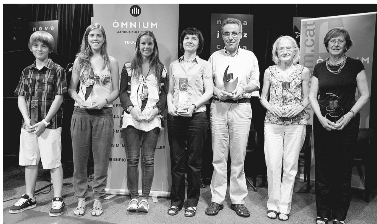
Los premiados en los distintos concursos que forman parte de la Nit del Misteri.