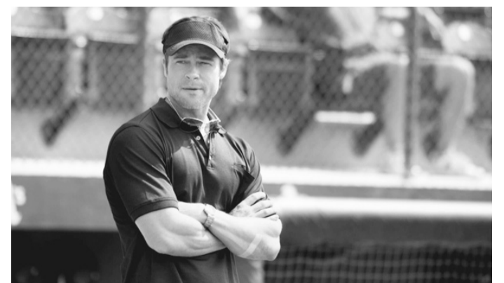
Buen guión y excelentes interpretaciones en “Moneyball”.

“Moneyball” es un film de deportes que carece de secuencias deportivas ya que, en realidad, es una cinta que habla, de una forma optimista y positiva pero no idealizada, de la necesidad de reinventarse para salir adelante en épocas de crisis. Beane, el protagonista, es el