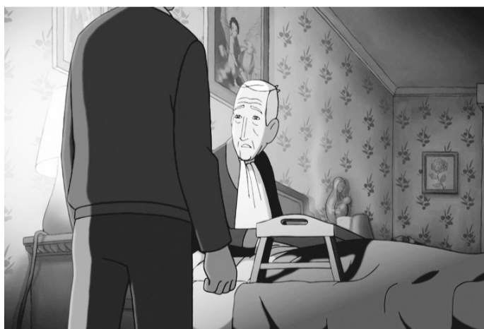
“Arrugues” ofrece un contenido lleno de ternura y de amistad.

La historia está ambientada en una residencia de ancianos, a la que llega un jubilado que padece importantes lagunas de memoria. La película habla de